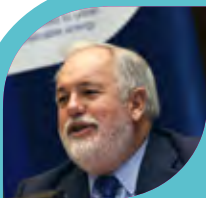
Miguel Arias Cañete

De forpligter sig til at udvikle handlingsplaner for bæredygtig energi og klimatiltag i 2030 og til at gennemføre lokale aktiviteter til afbødning af og tilpasning til klimaforandringer .