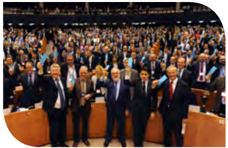
EU-Politiker und Bürgermeister unterstützen den Konvent der Bürgermeister für Klima und Energie symbolisch im Europäischen Parlament im Jahr 2015

EU-Kommissar für Klimapolitik und Energie