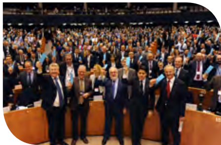
Los líderes y alcaldes de la UE respaldan de forma simbólica el Pacto de los Alcaldes para el Clima y la Energía en el Parlamento Europeo en 2015

Se comprometen a preparar Planes de Acción para la Energía Sostenible y el Clima para el año 2030 e implantar actividades locales de atenuación y adaptación al cambio climático .